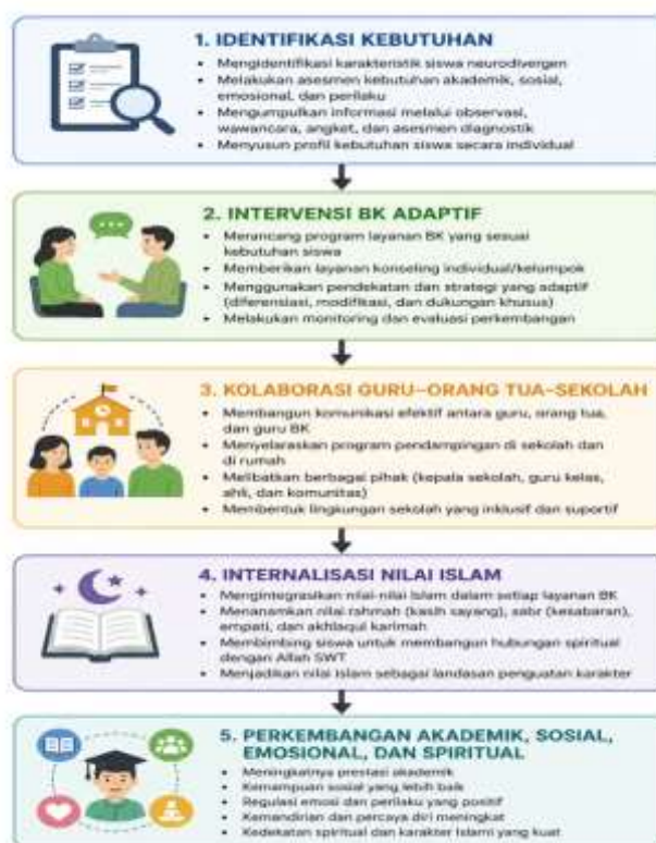
Gambar 2. <Konseptual Hasil Sintesis>

Berdasarkan hasil thematic synthesis , penelitian ini menghasilkan model konseptual peran guru BK Islami dalam mendukung siswa neurodivergen di Madrasah Ibtidaiyah.